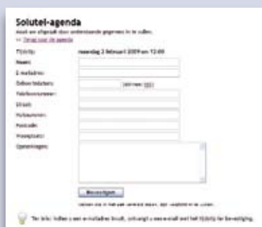
Scherm voor boeking

U kan 30 dagen gratis en vrijblijvend proberen.